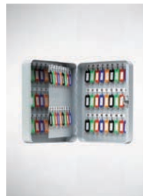
Armario 90 llaves.