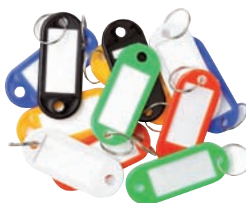
PORTA ETIQUETAS PARA LLAVES A-1642052