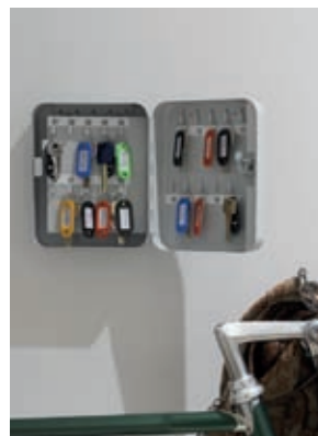
Armario 20 llaves.