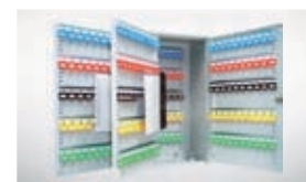
Armario 300 llaves.