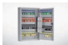
Armario 60 llaves.