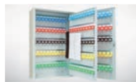
Armario 200 llaves.