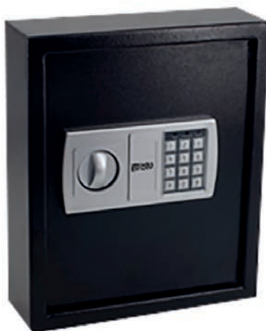
Mod. 48 llaves