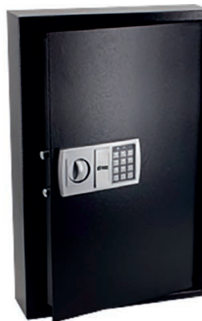
Mod. 144 llaves