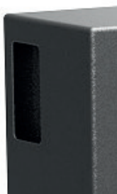
Apertura lateral para depósito de llaves