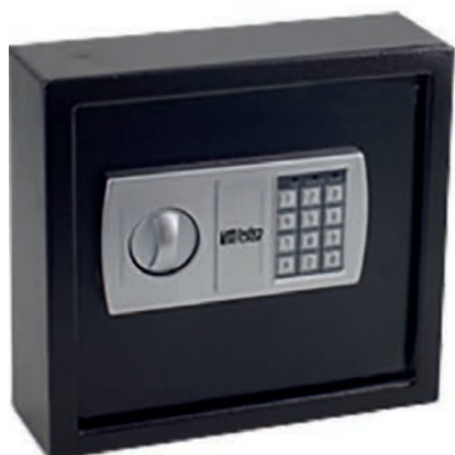
Mod. 30 llaves

Portallaves con código de uso + llave de emergencia. Fijación a parte trasera. Dispone de dos bulones de Ø20 mm. Incluye apertura lateral para depósito de llaves mientras la puerta está cerrada. Ideal para servicios de alquiler de coches/pisos.