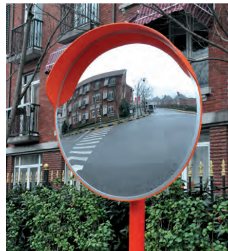
MIR003. Espejo convexo acrílico y armazón de polipropileno color naranja, con visera protectora.