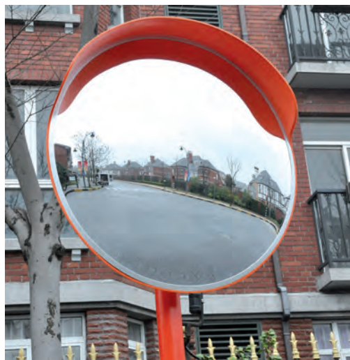
MIR002. Espejo convexo de policarbonato y armazón de polipropileno color naranja, con visera protectora.