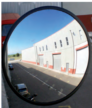
MIR000. Espejo convexo de policarbonato y armazón de polipropileno color negro.