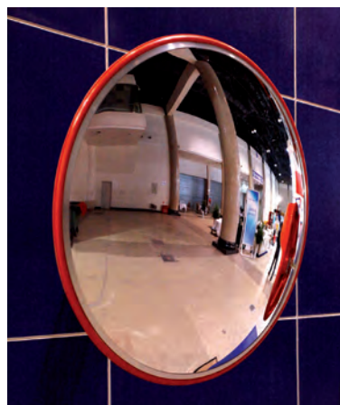
MIR001. Espejo convexo de policarbonato y armazón de polipropileno color naranja.