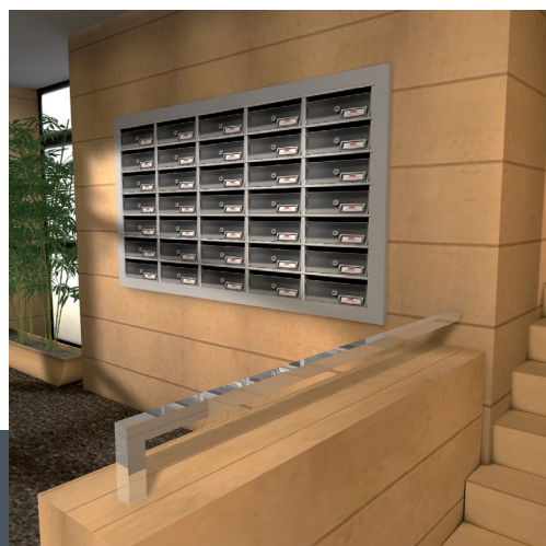
Instalación acabado antracita.

SIN COSTE PLACAS GRABADAS Y PERSONALI- ZADAS