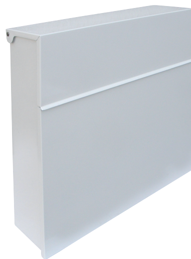
BLANCO E-6501 * 722947