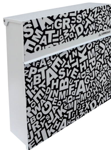
WORDS E-6512 * 722961