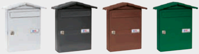
Blanco Negro Marrón tierra Verde